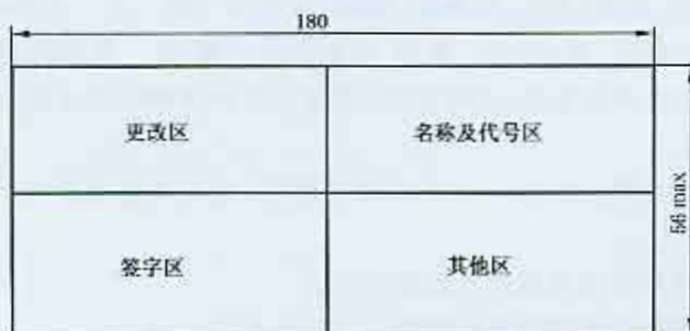
图 3 标题栏的分区(二)