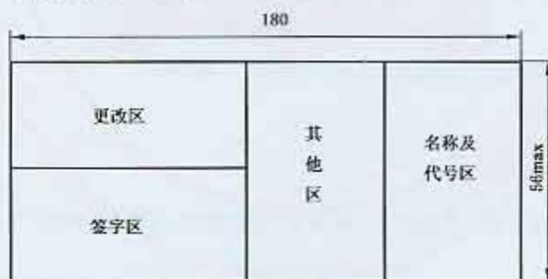
图 2 标题栏的分区(一)